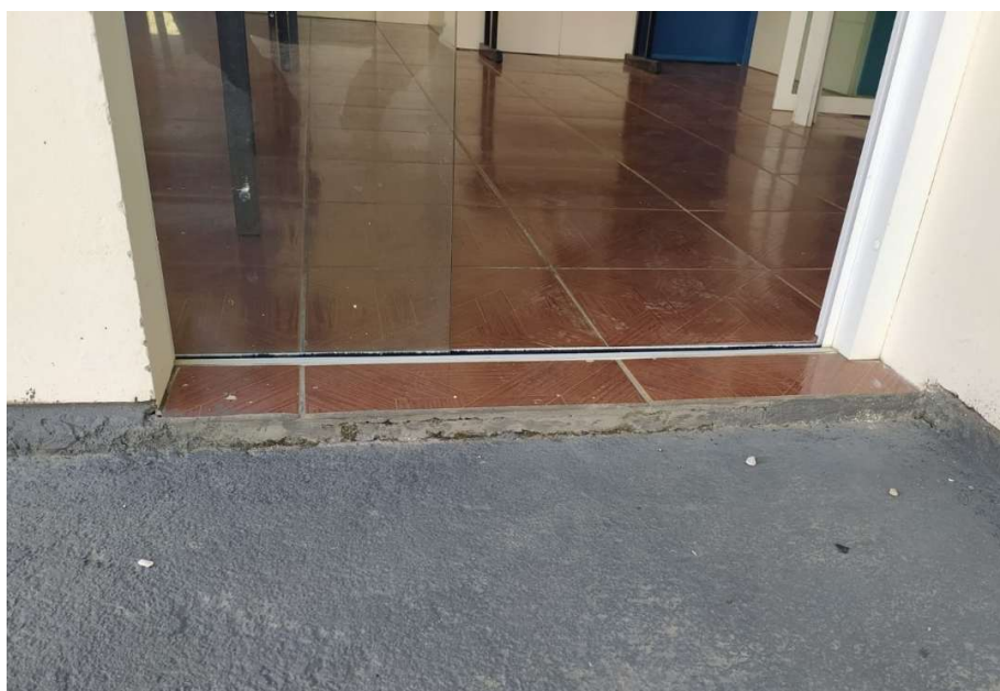
Figura 5 – Degrau a ser regularizado

Os desníveis serão tratados de acordo com o item 6.3.4 da NBR 9050, respeitando a inclinação máxima de 50%.