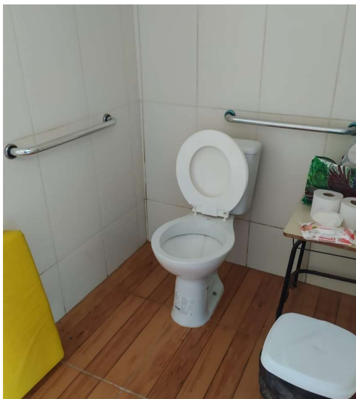
Figura 3 – Banheiro existente a ser adaptado