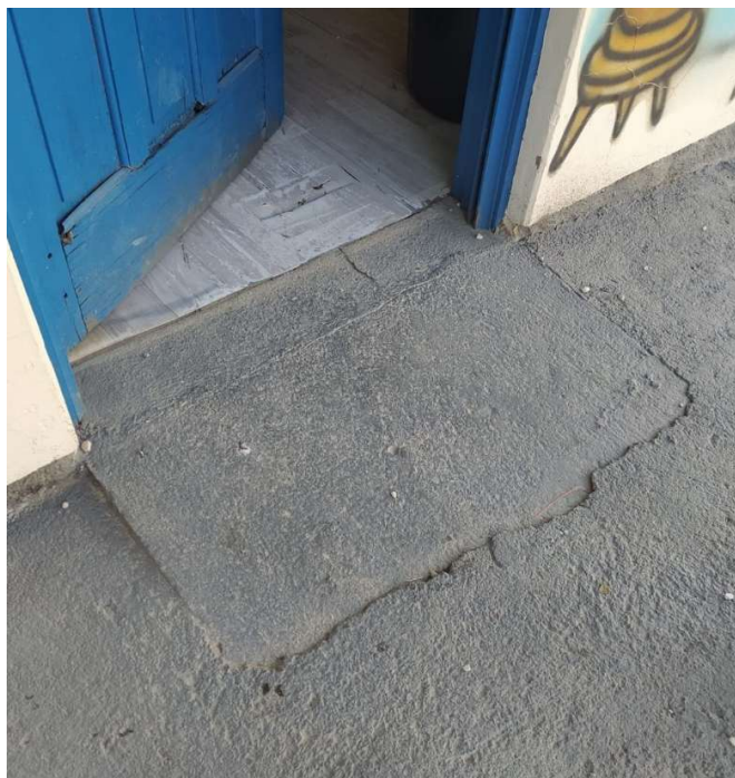
Figura 6 – Rampa deteriorada a ser regularizada

Praça Leonardo Sell, 40 – Fones: (48) 3275-3100 / Fax: (48) 3275-0472 - CEP 88470-000 Centro – Rancho Queimado – Santa Catarina – e-mail: pmrq@intergate.com.br CNPJ 82.892.357/0001-96