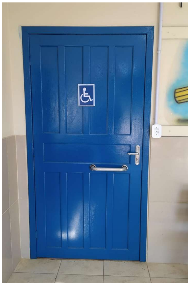
Figura 4 – Porta de acesso do banheiro acessível existente

*As portas de salas de aula com menos de 80cm de largura serão trocadas por uma que atenda ao tamanho mínimo.