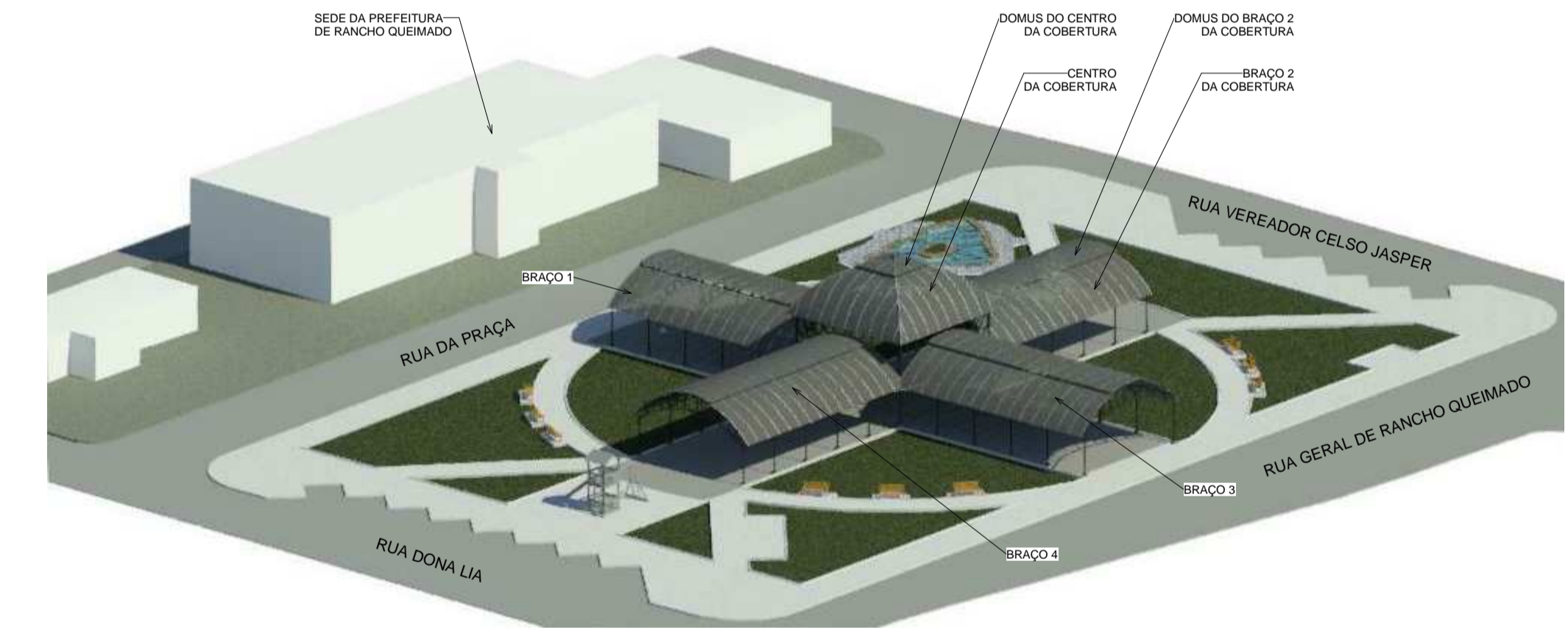
1 Imagem 2 Escala 1 : 1