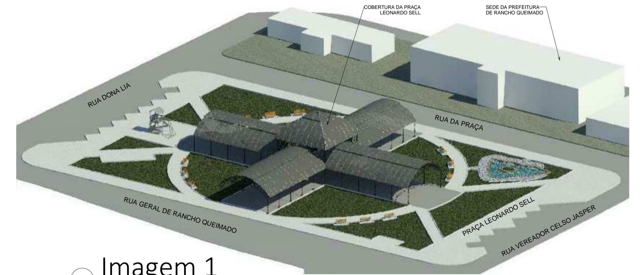
4 Imagem 1 Escala 1 : 1