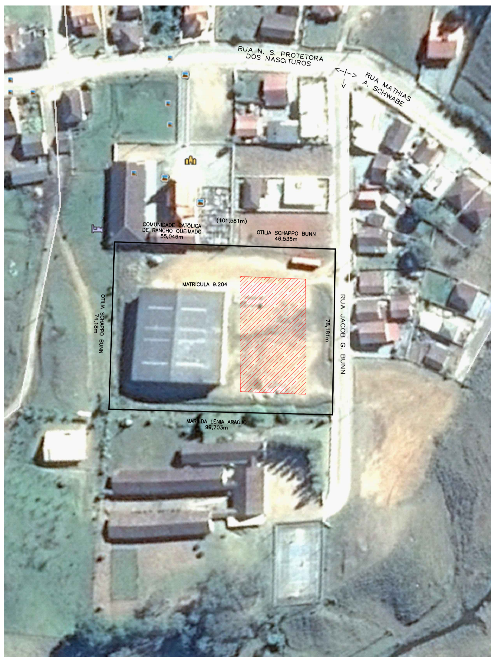
IMAGEM DE SATÉLITE PARA IDENTIFICAÇÃO DO LOCAL PROJETADO PARA IMPLANTAÇÃO DE ESCOLA COM SEIS SALAS SEM ESCALA COORDENADAS (UTM - SIRGAS 2000) LATITUDE: 6.937.398,00 m SUL LONGITUDE: 695.418,00 m LESTE; FUSO: 22J